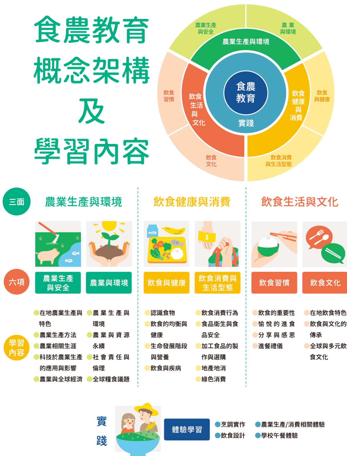
圖 1 食農教育 ABC 模式：食農教育三面六項

資料來源：林如萍，食農教育之推展策略（一）：學校教育實施之概念架構分析，106 年度國立臺灣師範大學產學合作計畫研究報告，頁 28。