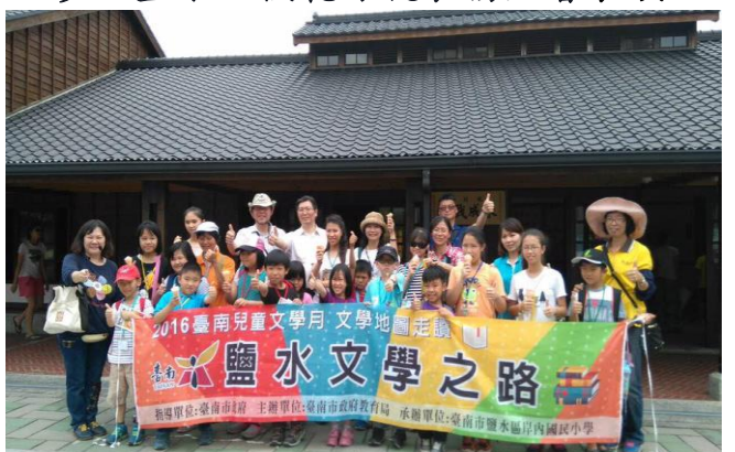
台南兒童文學月鹽水走讀活動