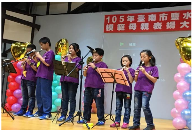
參加鹽水區模範母親表揚大會表演