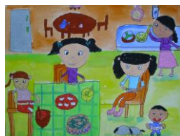
3 甲 陳雅鈞 家庭