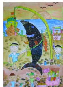
4 甲 廖逸凡 海洋