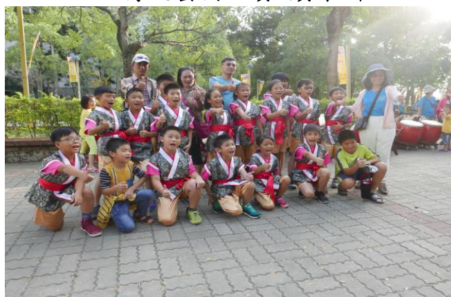
傳統藝術比賽~鼓術