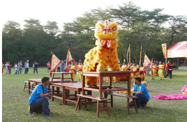
傳統藝術比賽~廣東獅