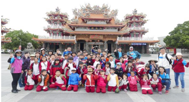
戶外教學~四草環境教育之旅