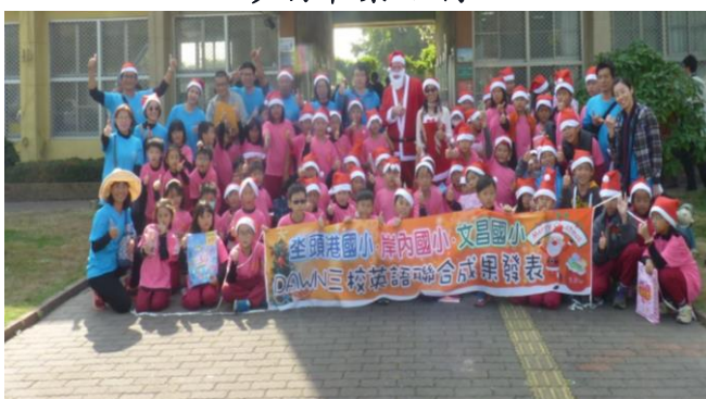
英語三校聯盟闖關暨成果發表會